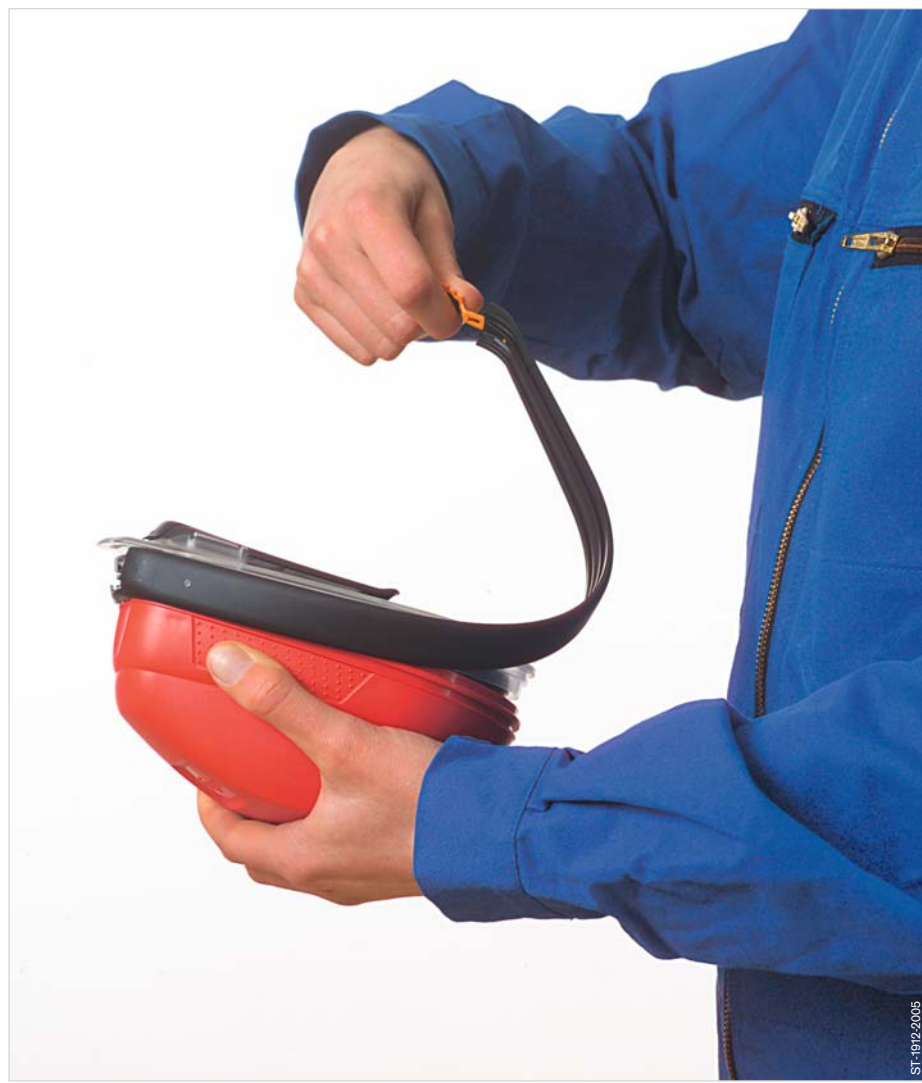
Remove the sealing band.