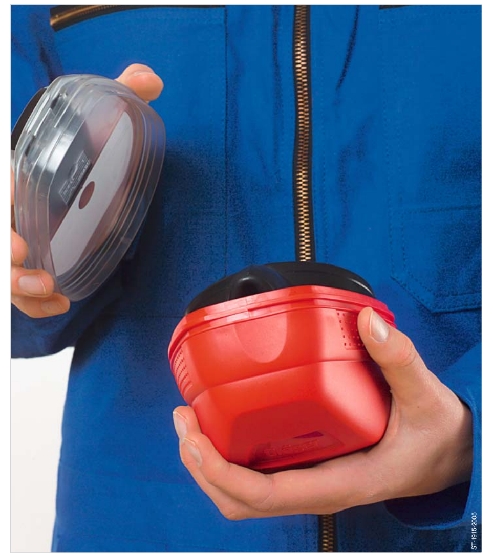
Open the housing.