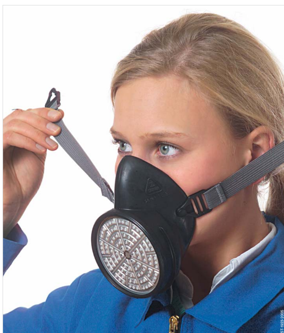
Halbmaske an den Bändern fassen, vor Mund und Nase halten, Kinn in die Kinnmulde legen.