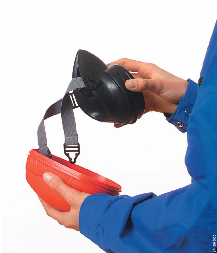
Take out the unit.