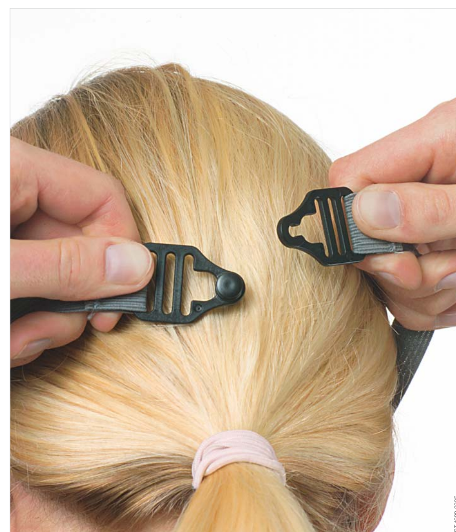
Bänderung hinter dem Kopf schließen und unverzüglich aus dem Gefahrenbereich flüchten.