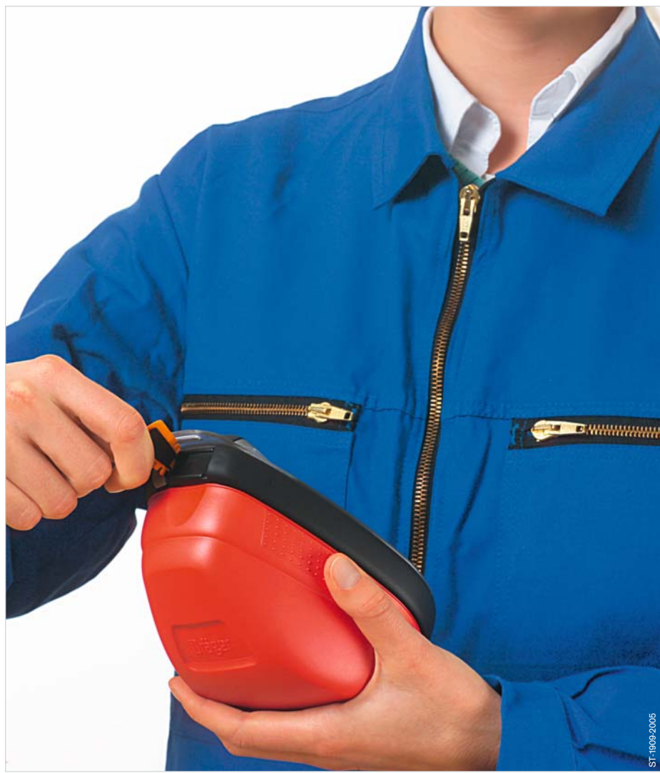
Grasp tab and pull.