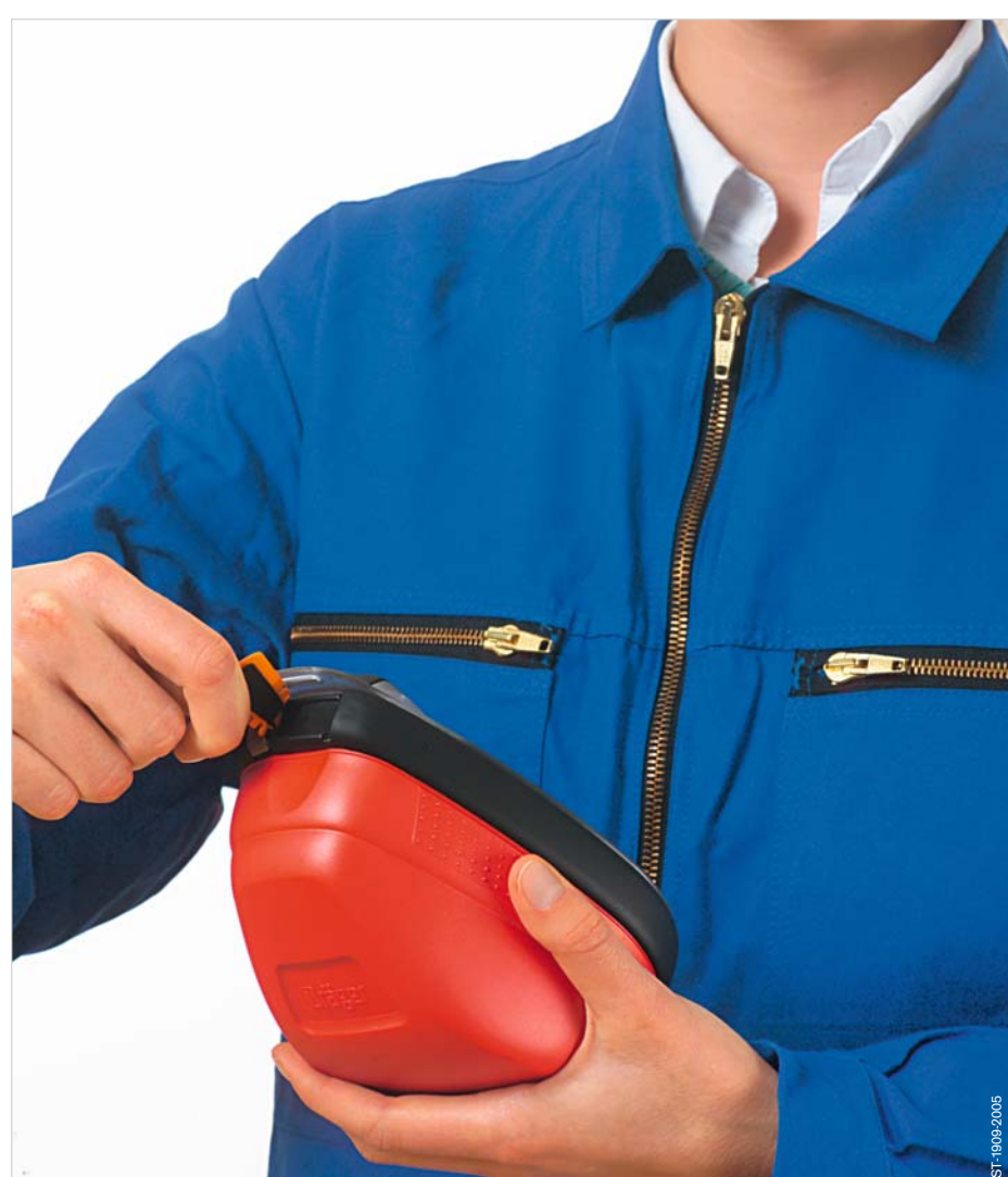
Plombe mit der Lasche aufreißen.